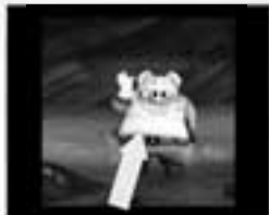
Motiv gut zentriert.

Zur Steuerung von Jade im Kampf, lies bitte den Abschnitt Kampf & Super-Angriff.