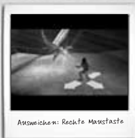
Ausweichen: Rechte Maustaste

Die Gefährten nehmen auf eigene Faust an den Kämpfen teil, wann immer es möglich ist. Jeder der Gefährten verfügt allerdings auch über einen besonderen Angriffsmodus, den er nur auf Jades Befehl hin ausführt. In einigen Fällen ist es für Jade und ihre Gefährten essentiell, dass sie gut kooperieren, wenn sie einen Kampf gewinnen möchten. Um einen Gefährten aufzufordern, seinen Spezial-Angriff auszuführen, drückst du auf die Taste E.