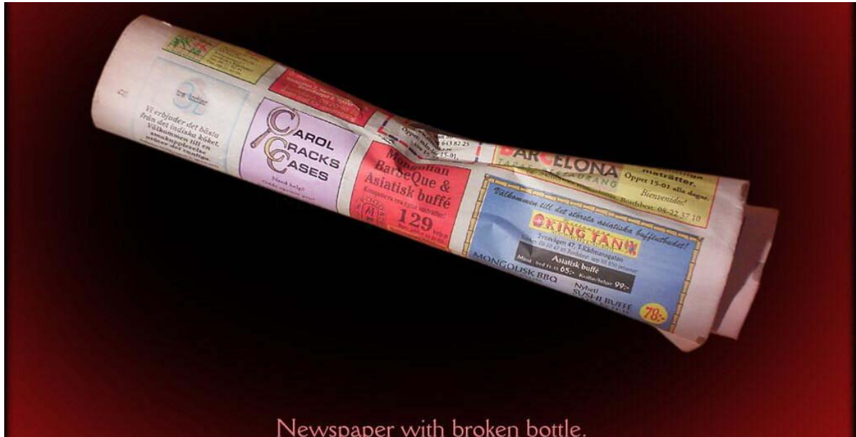
Newspaper with broken bottle.

Also müssen wir uns etwas einfallen lassen. Wir gehen zurück u. sehen uns um. Rechts neben der Haustür steht eine leere Flasche die wir mitnehmen! Im Inventar befindet sich nun Hammer, Zeitung u. Flasche . Wir benutzen die Zeitung mit der Flasche u. dem Hammer.